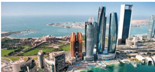
ABU DHABI YACHT AND SAILING CLUB